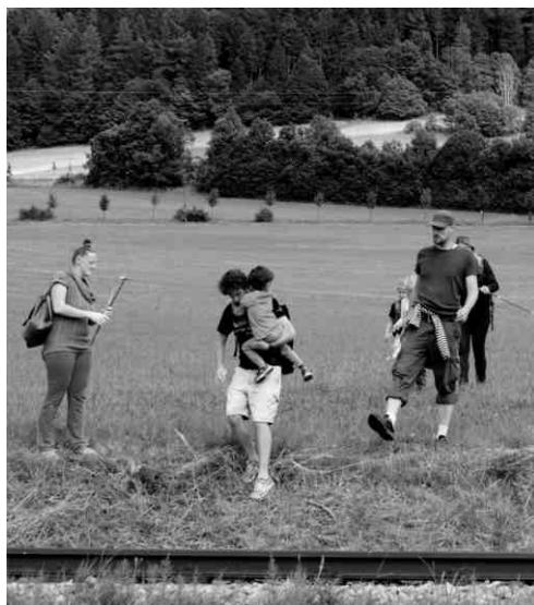
Navštívili jsme sbor v Horní Čermné, Mariánskou horu s rozhlednou a poutním kostelem, a prozkoumali jsme důkladně okolí našeho penzionu na konečné lokálky.